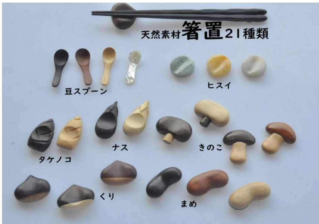
天然素材 箸置 21種類