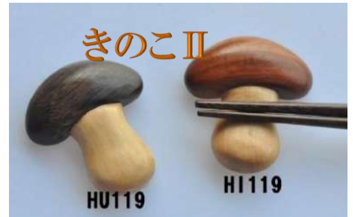
出来ました、かわいい”きのこⅡ”です

タケノコ、なす、きのこの3種の野菜を加えて、季節感を楽しめるようにしました。 いずれも手削りで制作しています。