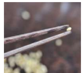
細く、つかみ易い先四角

備考) 鉄刀木(タガヤサン)は紫檀・黒檀と同類の唐木の種類です。水に沈むほど重く、木質は硬く、外観は緻密で綺麗な年輪模様が特色な貴重な天然木です。