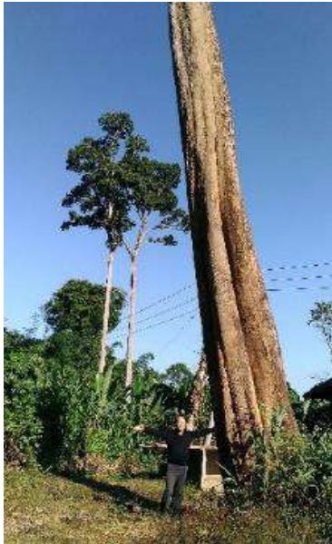
天然の鉄刀木の巨木